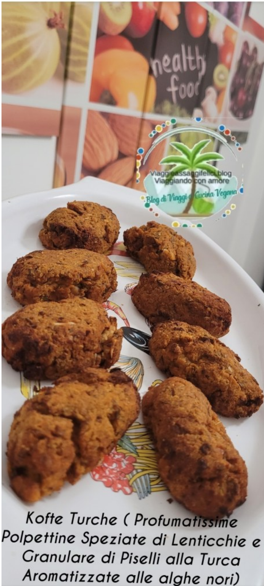
Kofte Turche ( Profumatissime Polpette Speziate di Lenticchie e Granulare di Piselli alla Turca Aromatizzate alle alghe nori)