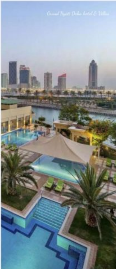
Grand Hyatt Doha Hotel & Villas